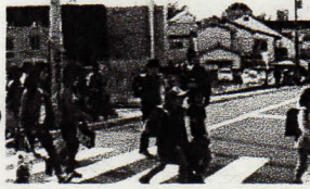
街頭活動中の 柘野交番員