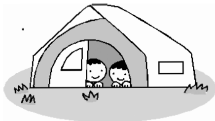
テントに泊まるう!